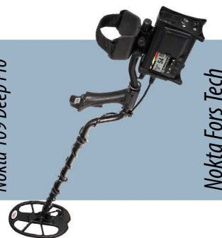
Nokta Fors Tech