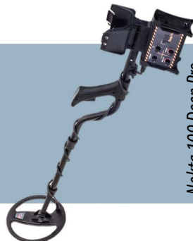
Nokta 109 Deep Pro