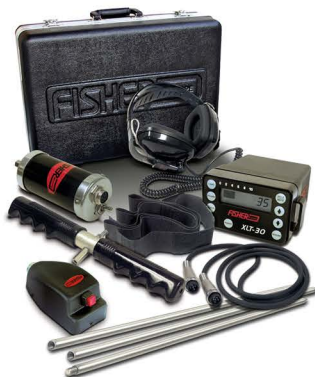
Fisher XLT-30 C Little Foot mikrofon & hydrophonická sonda