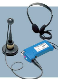
Fuji Tecom LD-7