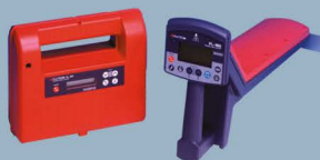
Fuji Tecom PL-960