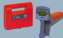
Fuji Tecom PL-2000