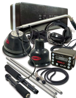
Fisher XLT-30 D Big Foot & Multi-Sensor mikrofon