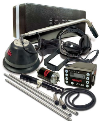
Fisher XLT-30 A Big Foot mikrofon & hydrophonická sonda