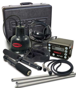
Fisher XLT-30 B Multi-Sensor mikrofon