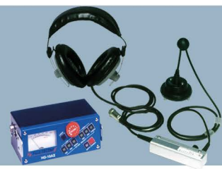
Fuji Tecom HG-10All