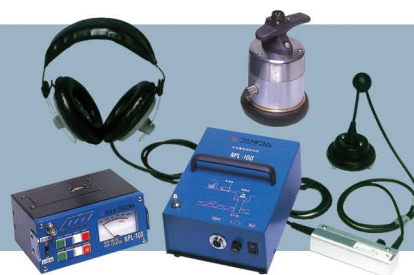
Fuji Tecom NPL-100